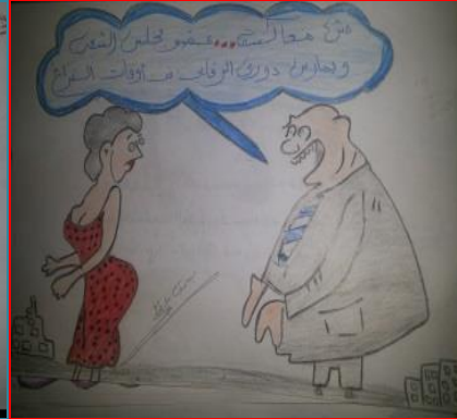
شكل (٤١) الصف الثالث الثانوي "رجل من (٣٠:٤٠) سنة فيما فوق"