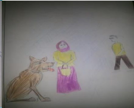
شكل (٣٩) الصف الأول الثانوي "شاب من (١٨:٢٠) سنة"