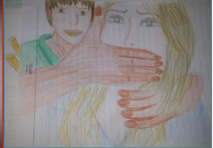
شكل (٢٠) الصف الثالث الثانوي "تحرش وتعدي بالضرب" شكل (٢١) الصف الثالث الثانوي "تحرش وتعدي بالضرب" شكل (٢٢) الصف الأول الثانوي "تحرش وتعدي بالضرب"