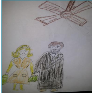
شكل (٤٠) الصف الثالث الثانوي "رجل من (٢٠:٣٠) سنة"