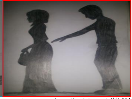
شكل (١٤) الصف الثالث الثانوي "لمس جسد الانثى" شكل (١٥) الصف الثالث الثانوي "لمس جسد الانثى" شكل (١٦) الصف الثالث الثانوي "لمس جسد الانثى"