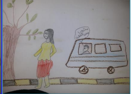
شكل (٢٦) الصف الثالث الثانوي "بيدي لها اشارات جنسية" شكل (٢٧) الصف الثالث الثانوي "بيدي لها اشارات جنسية" شكل (٢٨) الصف الثالث الثانوي "تجريد الملابس"