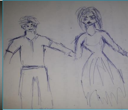
شكل (٣٨) الصف الثالث الثانوي "شاب من (١٨:٢٠) سنة"