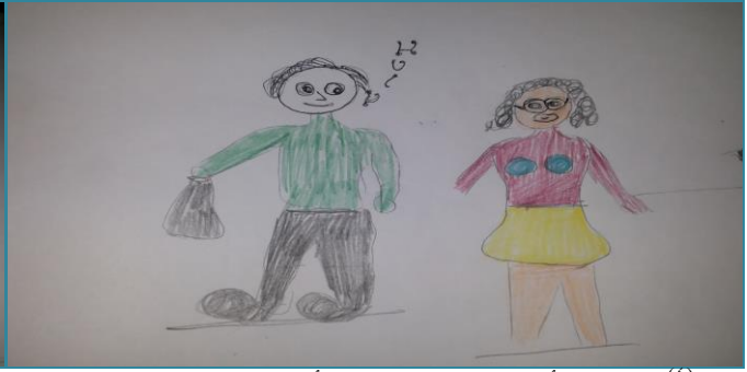
شكل (٤) الصف الأول الثانوي "التصغير أثناء السير بالشارع"