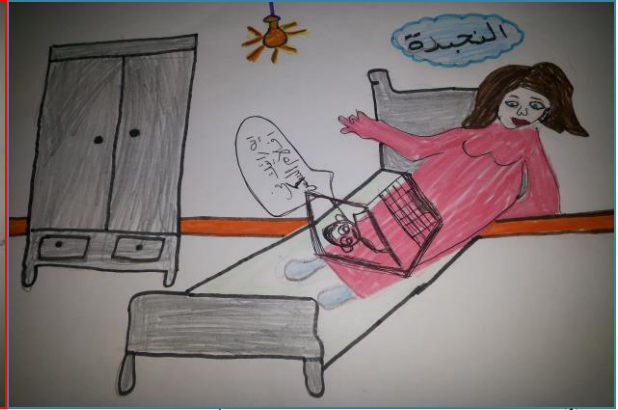
شكل (٩) الصف الثالث الثانوي "ارسال صور إباحية للأنثى عبر وسائل الاتصال"