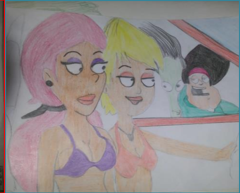
شكل (٤٢) "مراقبة الجيران من النافذة"