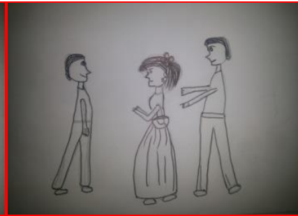
شكل (٣٥) الصف الأول الثانوي "طفل أقل من (١٨) سنة"