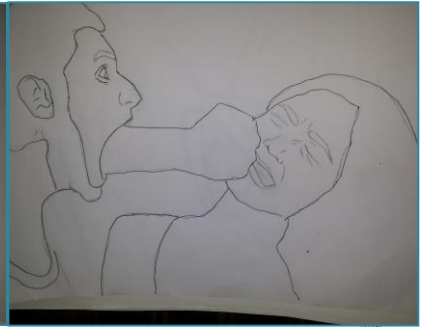
شكل (٢٣) الصف الثالث الثانوي "تحرش وتعدي بالضرب" شكل (٢٤) الصف الثالث الثانوي "تحرش وتعدي بالضرب" شكل (٢٥) الصف الثالث الثانوي "بيدي لها اشارات جنسية"