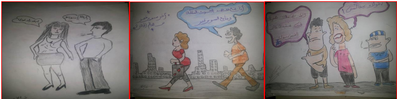
شكل (١) الصف الثالث الثانوي "المعاكسات الكلامية" شكل (١) الصف الأول الثانوي "المعاكسات الكلامية" شكل (١) الصف الأول الثانوي "المعاكسات الكلامية"

عكست الرسوم الضغط النفسي الذي تعيشه الإناث من جراء التحرش وهو ما انعكس في البكاء، كما عكس الإناث ضعفهن من خلال الاستجداد شكل (٩)، وحالة الهروب الدئمة من المتحرش الذي يلاحقها في كل الأماكن بشتي المظاهر، كما عكست الشعور بالعجز أمام المتحرش فأظهرن تكالب الذكور عليهن وكأنهن فرائس شكل (٢٣:١٢)، وهو ما يؤكد لديهن الضعف والدونية ويعزز لديهن المعتقدات السلبية عن ذواتهن وضعف الثقة بالنفس، وهو ما يتفق مع دراسة "Juliette C Reder storff vicole T. settles (2007) والتي أكدت على الآثار النفسية السلبية الناتجة عن التحرش الجنسي مثل المعتقدات السلبية عن النفس وضعف المعتقدات الشخصية وضعف الثقة بالنفس والشعور بالعجز والعرق والضغط النفسي.