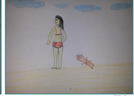
شكل (١٧) الصف الثالث الثانوي "لمس جسد الانثى" شكل (١٨) الصف الأول الثانوي "لمس جسد الانثى" شكل (١٩) الصف الأول الثانوي "لمس جسد الانثى"