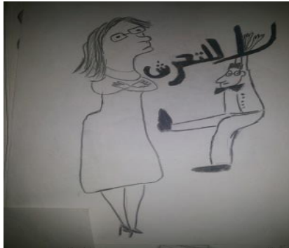
شكل (٣٧) الصف الثالث الثانوي "شاب من (١٨:٢٠) سنة"