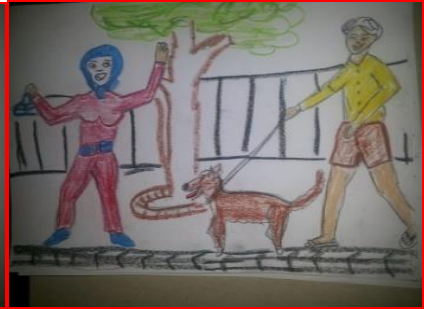
شكل (٣٦) الصف الثالث الثانوي "طفل أقل من (١٨) سنة"