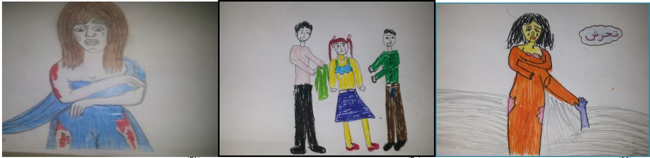
شكل (٣١) الصف الثالث الثانوي "تجريد الملابس"